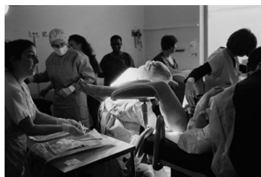
Equipe en salle de travail, France, 2005. Limitée à un quart de page et exclusivement pour annoncer l'expo