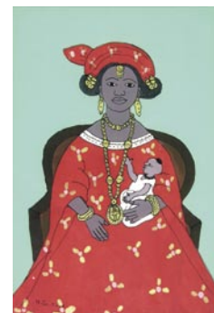
Peinture sur verre, Sénégal, 2001. Collection particulière D. Ponsard / MNHN