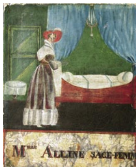
Enseigne de sage-femme, France, 1815-1830.