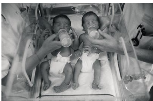
Jumeaux, France, 1990. Photo de Valérie Winckler Limitée à un quart de page et exclusivement pour annoncer l'expo