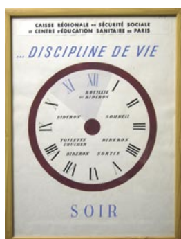
« Respectez pour lui une stricte hygiène de vie », Musée de l'Assistance Publique-Hôpitaux de Paris D. Ponsard / MNHN