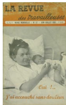
Couverture de La revue des travailleuses, n°12, Juin-Juillet 1953, IHS CGT Métallurgie D. Ponsard / MNHN